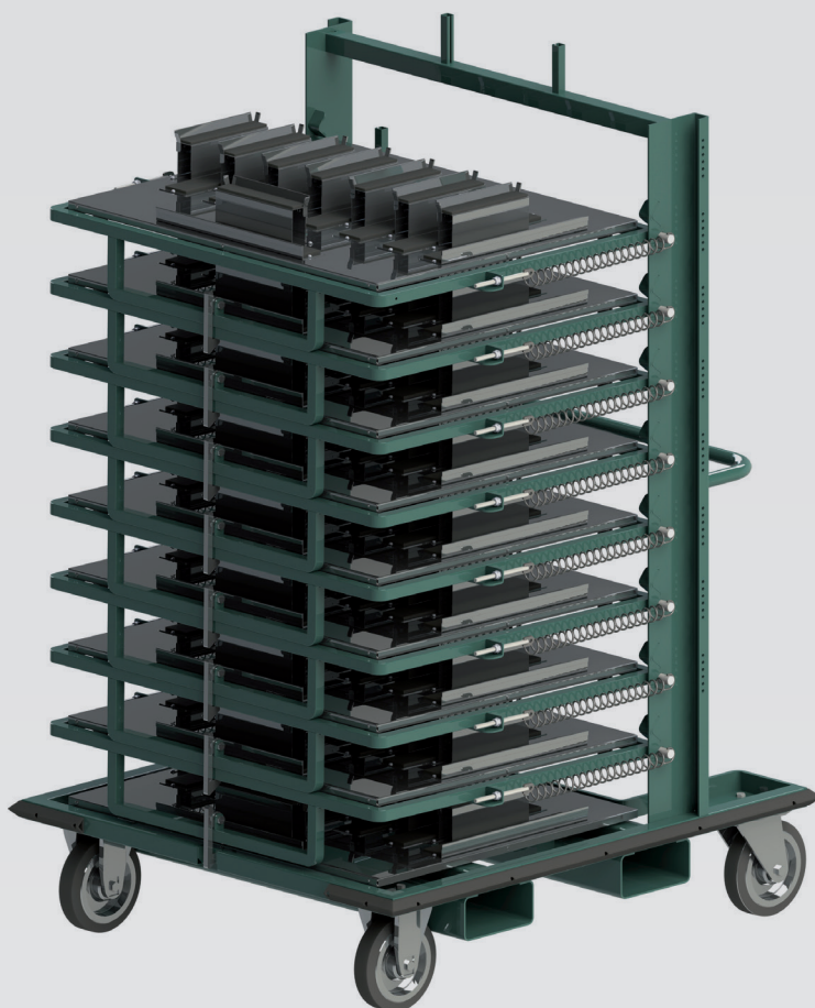
PRODUCTION TROLLEY WITH ADJUSTABLE LOCKING SHELVES