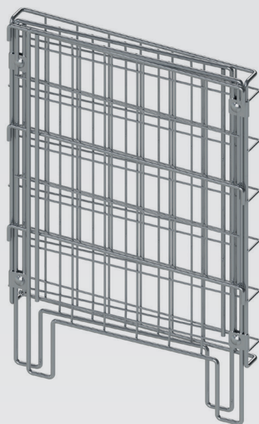
BAC FOUILLE REPLIÉ